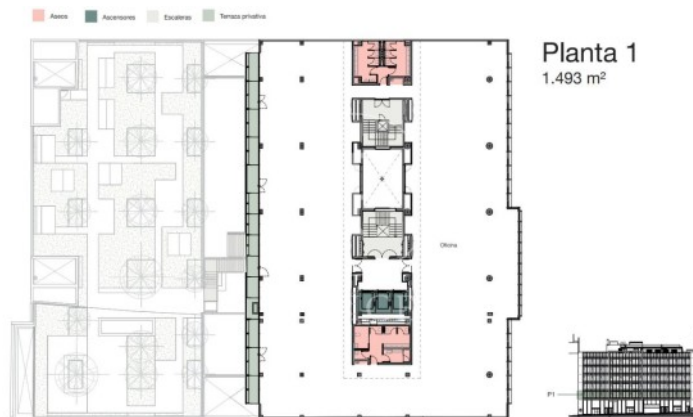
Planta 1 1.493 m 2