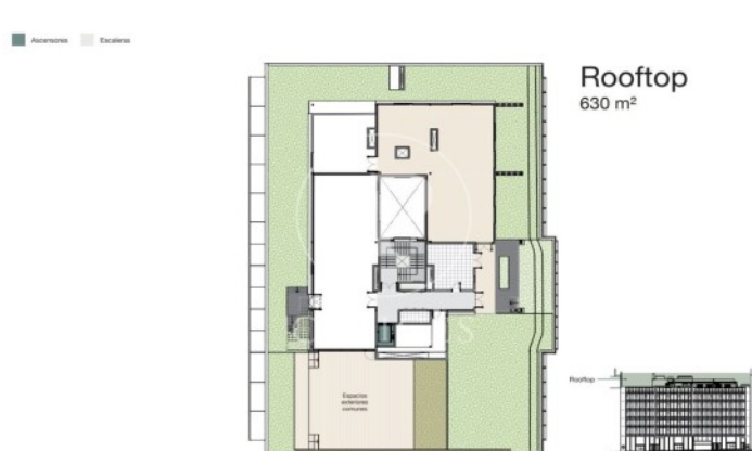
Rooftop 630 m 2

Les dades de cada immoble no són part d'una oferta o contracte. No s'ha de considerar exactes o factuais les declaracions fetes per aProperties, verbalment o per escrit, respecte de l'immoble, l'estat en què es troba o el seu valor. Les fotografies només mostren unes parts determinades de l'immoble tal com eren al moment que es van prendre. Les àrees, dimensions i les distàncies que es proporcionen només són aproximades i han de ser comprovades pel client. Les imatges generades pel l'ordinador solament són una indicació de la possible aparença de l'immoble, i poden canviar a qualsevol moment. La informació respecte a un immoble és susceptible de canviar a qualsevol moment.