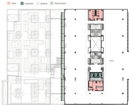
Planta 2 a 5 1.493 m 2