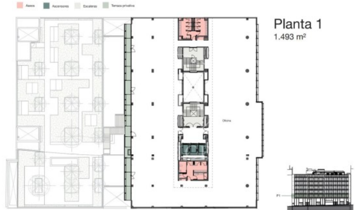
Planta 1 1.493 m 2