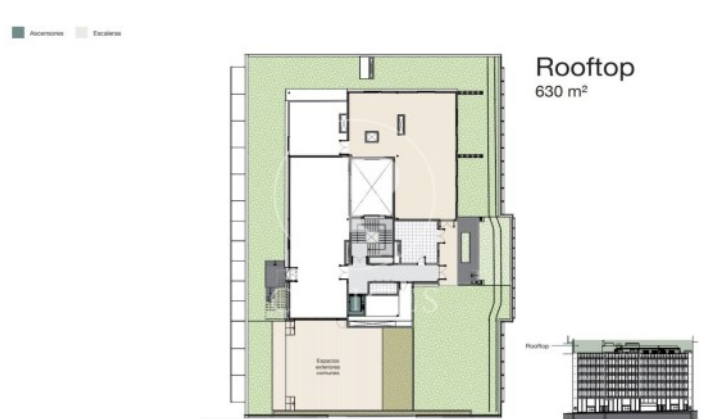
Rooftop 630 m 2

Les dades de cada immoble no són part d'una oferta o contracte. No s'ha de considerar exactes o factuais les declaracions fetes per aProperties, verbalment o per escrit, respecte de l'immoble, l'estat en què es troba o el seu valor. Les fotografies només mostren unes parts determinades de l'immoble tal com eren al moment que es van prendre. Les àrees, dimensions i les distàncies que es proporcionen només són aproximades i han de ser comprovades pel client. Les imatges generades pel l'ordinador solament són una indicació de la possible aparença de l'immoble, i poden canviar a qualsevol moment. La informació respecte a un immoble és susceptible de canviar a qualsevol moment.