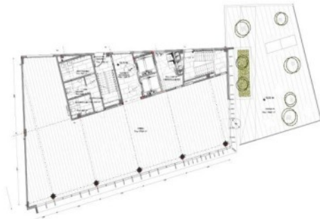
PLANTA QUINTA 558,39 m 2